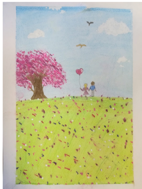
Figye Florentina: Tavasz

Igen ez történe, ha nem olvasnál. Egyszerűen kimaradnál egy jó dologból. Vannak barátaim, akik nem olvasnak, hát nem tudják miről maradnak le.