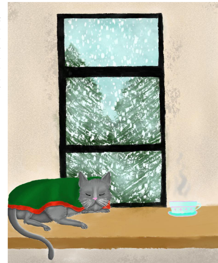
Fige Florentina (7.a): November