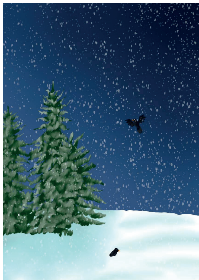
Fige Florentina (7.a): Január

Az iskola légköre pont olyan, amilyen közösséghez tartozni szeretek. A kollégák, akikkel a bent lételem során érintkezem segítőkészek, kedvesek és nyitottak az irányomban. A főnököm pedig... hát igen, főnökről vagy jót vagy semmit. De viccen kívül, remek vezetőmnek tartom és hálás vagyok neki is azért, hogy humánusan áll hozzám és nagy szabadságot ad nekem, amivel remélem, hogy nem élek vissza. Szerencsésnek érzem magam. Köszönöm hogy itt lehetek. Veletek. Köztetek.